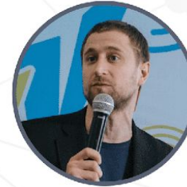
Андрей Емельянов директор Департамента информационной политики Министерства образования и науки РФ