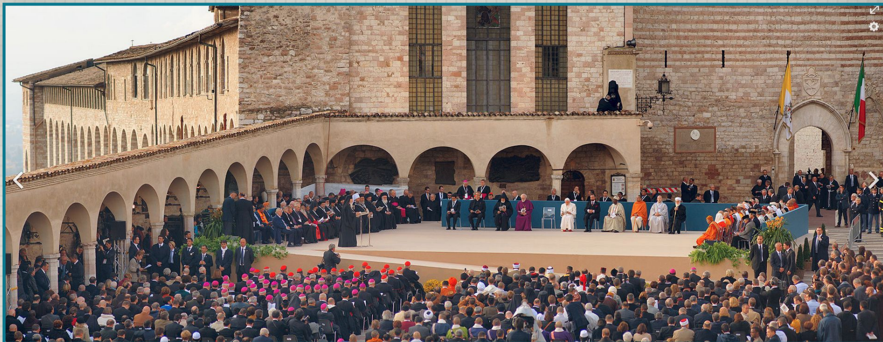
Международный день молитвы за мир. Италия. 27 октября 2011 г.

Пацифизм (лат. pacificus - миротворческий) - идеология сопротивления насилию ради его исчезновения. Пацифистское движение, движение за мир - антивоенное общественное движение, противодействующее военным методам решения политических конфликтов, в частности осуждением аморальности таких методов.