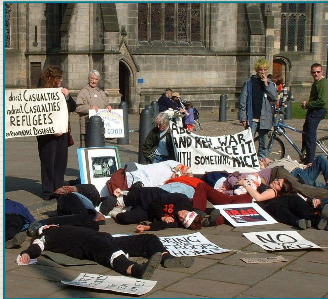
Антивоенная демонстрация на акции против вторжения в Ирак в 2003 г. Великобритания.

Современный паци-физм, получивший особенное раз-витие после Первой мировой вой-ны и обогащённый опытом кампа-ний ненасильственной борьбы, ко-торые проводили М.Ганди и М.Л. Кинг, настаивает на необходимос-ти активного сопротивления, но без использования уничтожающей силы.