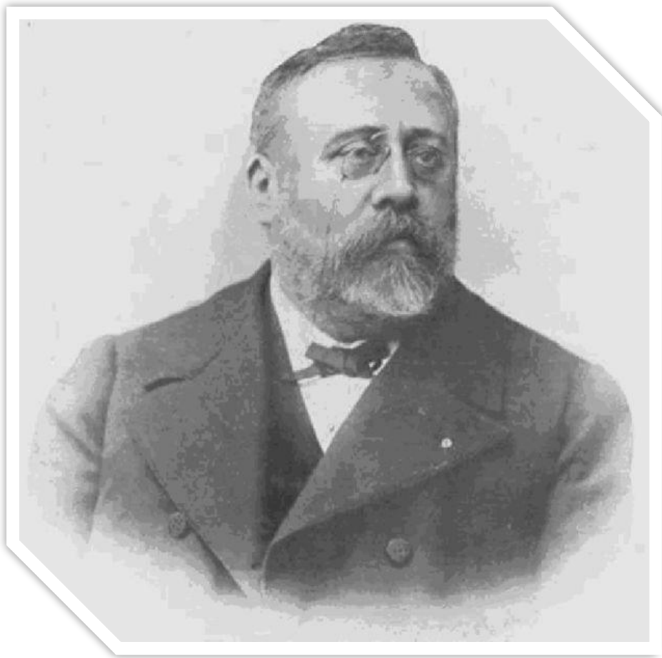
Адемар Эсмен (1848-1913)

Французский государствовед, характерный представитель юридической школы государствоведения, суть которой сводится к выведению государства из конституции формально-правовыми способами, к отождествлению государства с правопорядком, с системой государственно-правовых норм.