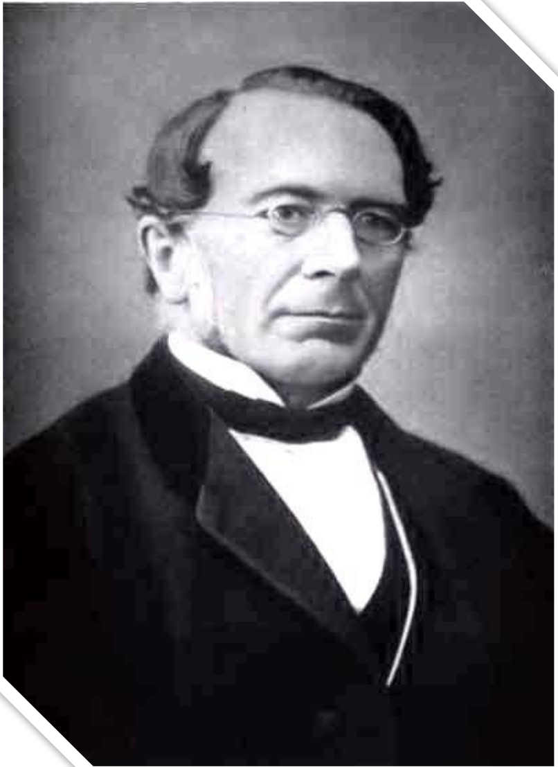
Рудольф Иеринг (1818-1892)

Известный немецкий юрист предпринял попытку применить некоторые идеи социологии к учению о праве и государстве. В своей книге « Цель в праве » (1872г.) стремился дать современным ему праву и государству социологическое обоснование. Социологические построения Иеринга сводились к рассуждению, что все члены современного ему общества солидарны в своих интересах и преследуют общие цели, соответственно право он определял как выражение всеобщих интересов .