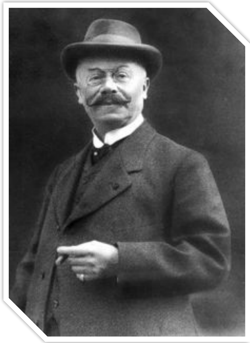
Георг Еллинек (1851-1911)

Своеобразную попытку соединить формально-догматическое понимание государства и права с социологией предпринял немецкий государствовед.