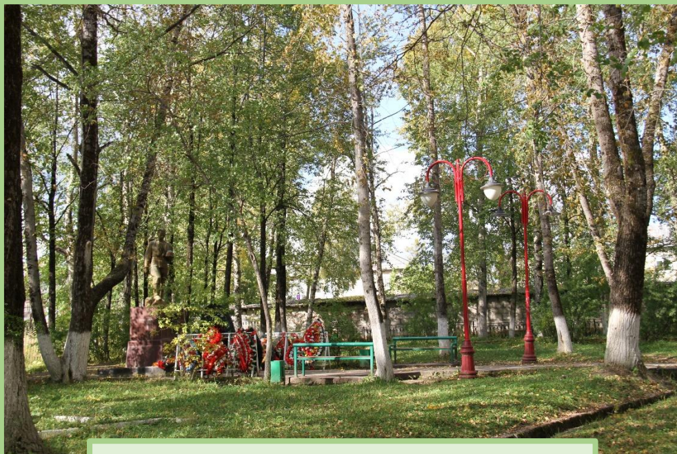
Вид на памятник в Парке