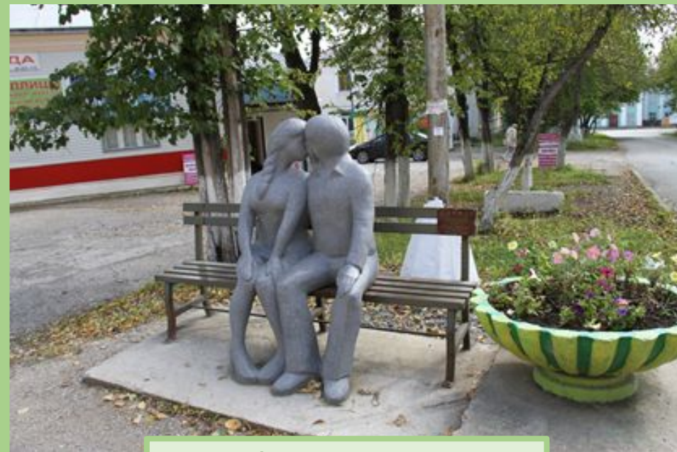
Арт-объект на ул. Ленина