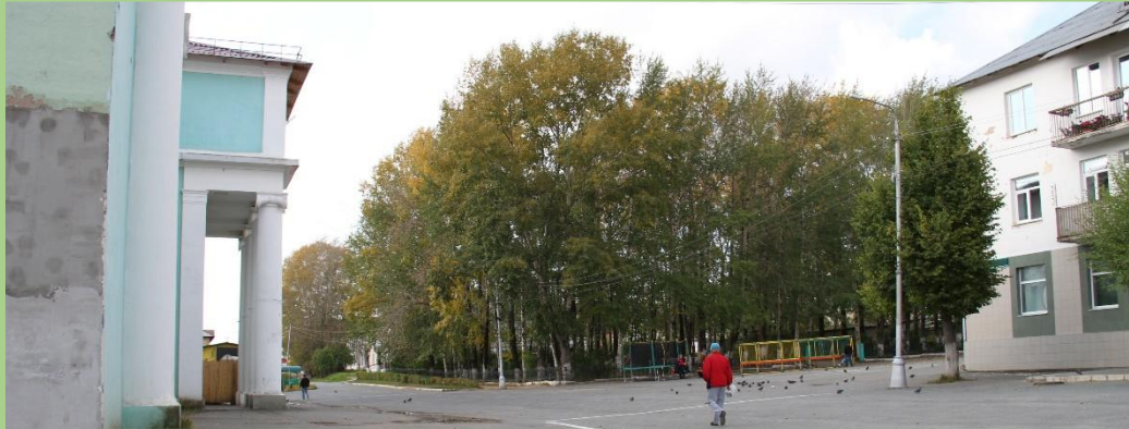
Вид на площадь, Парк Победы с ул. Свердлова