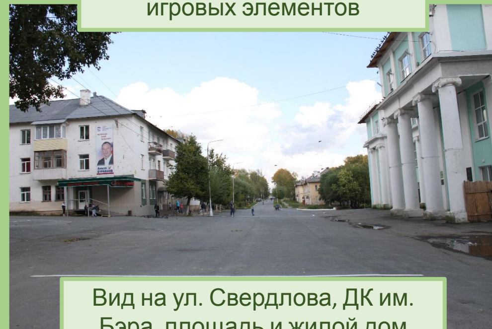
Вид на ул. Свердлова, ДК им. Бэра, площадь и жилой дом