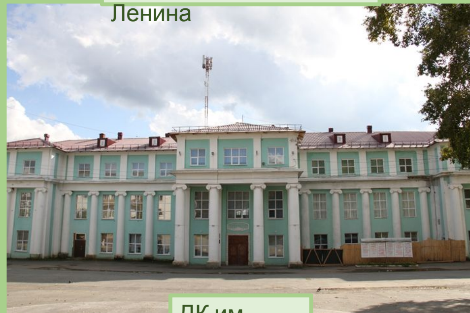
ДК им. Бара