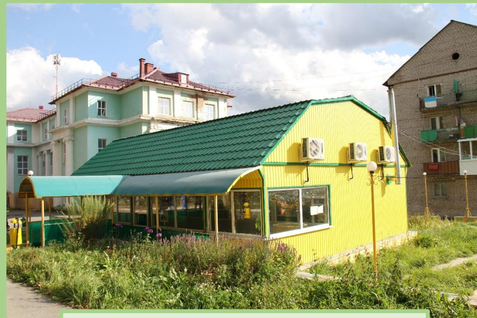
Продовольственный магазин у