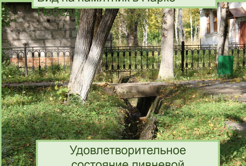
Удовлетворительное состояние ливневой канализации в парке