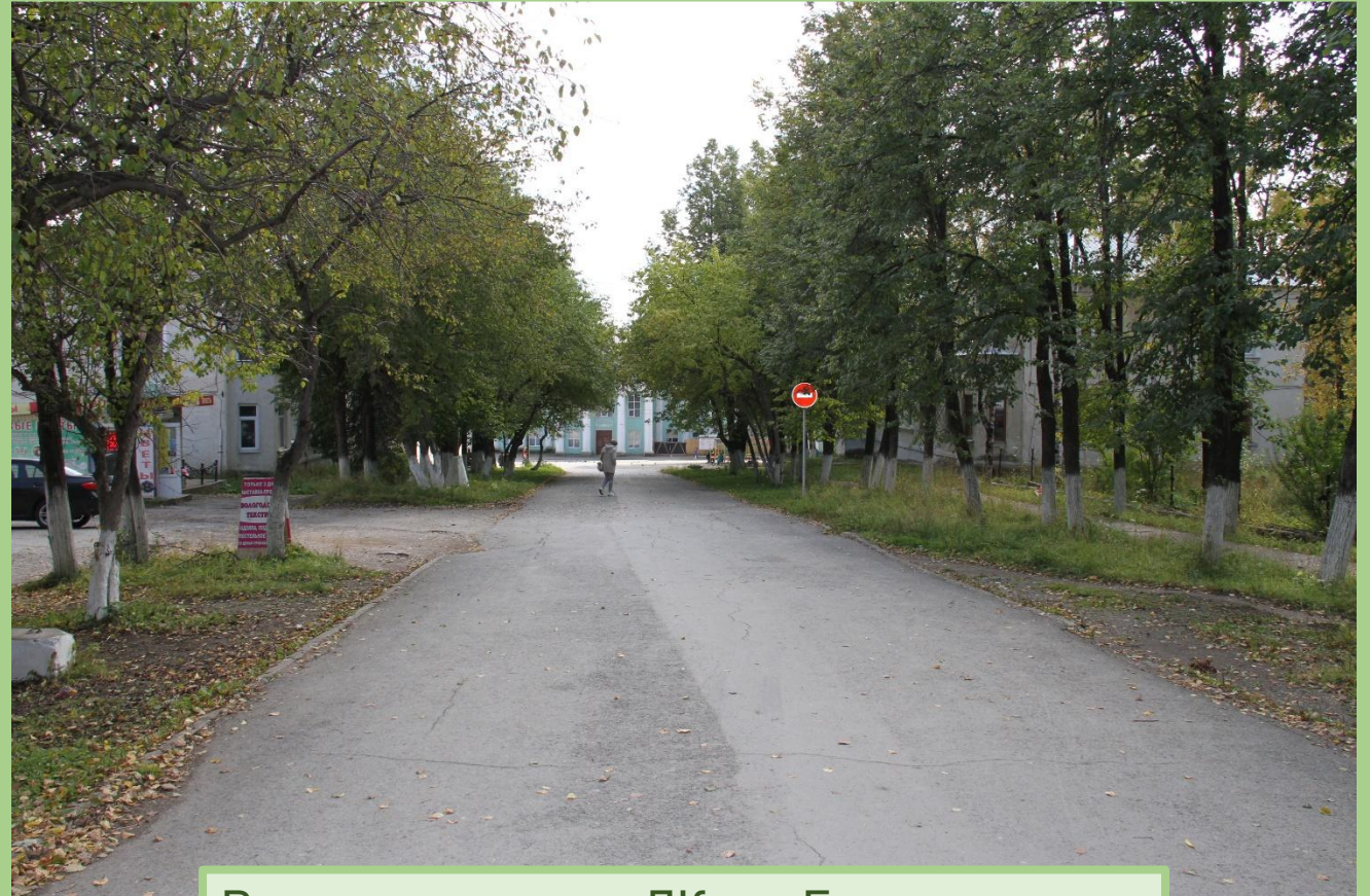
Вид на площадь и ДК им. Бэра с ул. Ленина