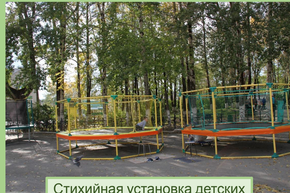
Стихийная установка детских игровых элементов