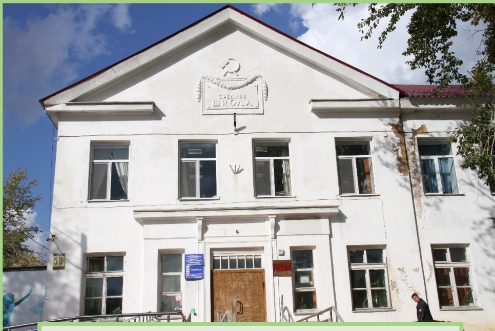
Музей и Библиотека на ул.