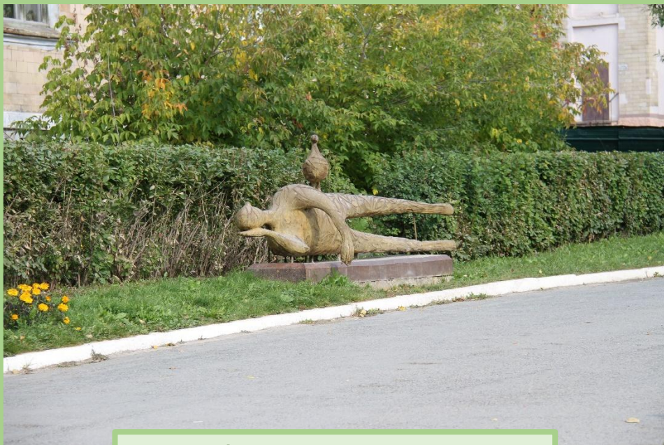
Арт-объект на ул. Свердлова