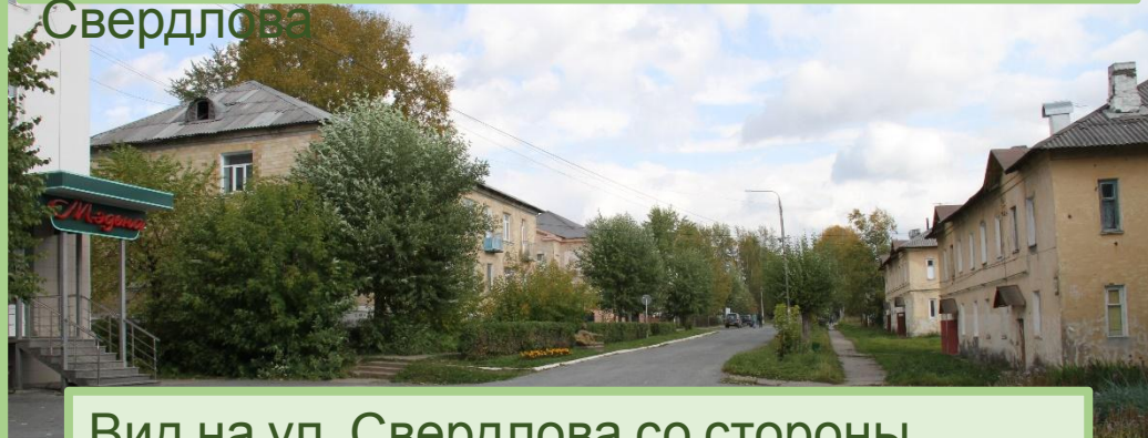
Вид на ул. Свердлова со стороны площади