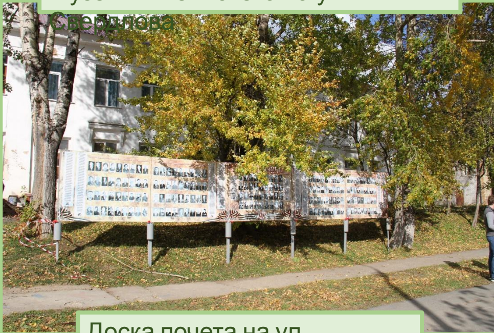
Доска почета на ул.