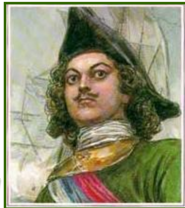
АЛЕКСЕЙ ТОЛСТОЙ Петр Первый