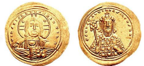
МОНЕТЫ СВ. РАВНОПОСТОЛЬНАГО ВЕЛИКАГО КНЯЗЯ ВЛАДИМИРА.

Возникновение самостоятельной чеканки монет относится к периоду становления Древнерусского государства Киевская Русь. Первые монеты появились при правлении князя Владимира (конец X-начало XI в.в.).