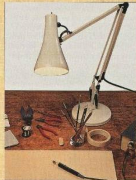
Настольная лампа, карандаши, точилка, ластик, копировальная бумага, кисточки, краски, рисунок