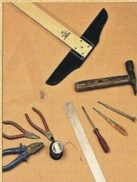
Пассатижи, наковальня, кусачки, отвёртки, молоток, линейки