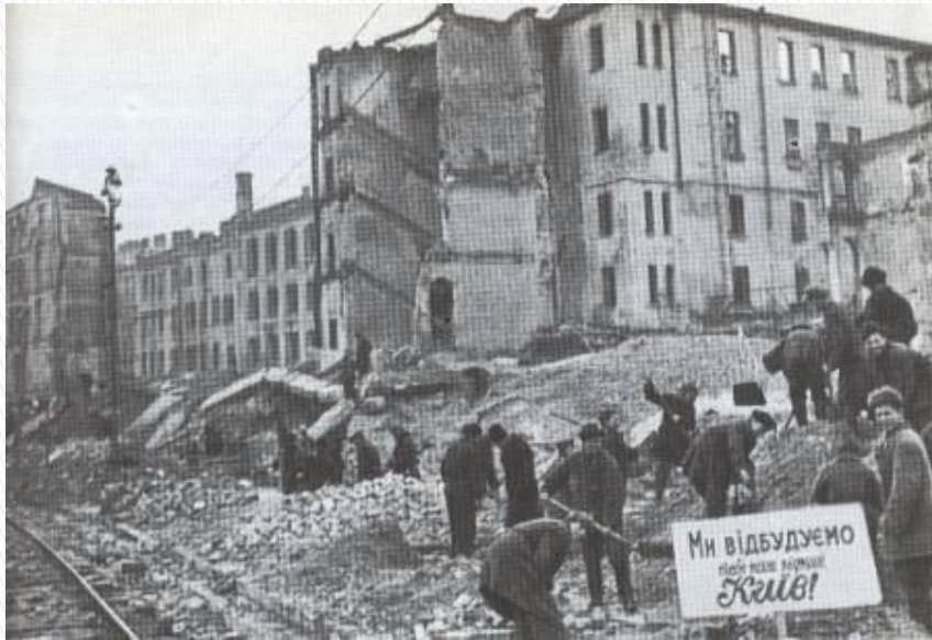
Кияни на Хрещатику