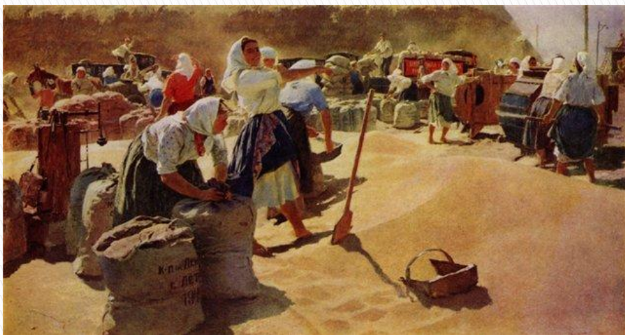
“Хліб” Т.Яблонська 1949 рік