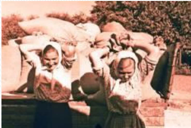
Бровари, розвантаження хліба, 1946 рік