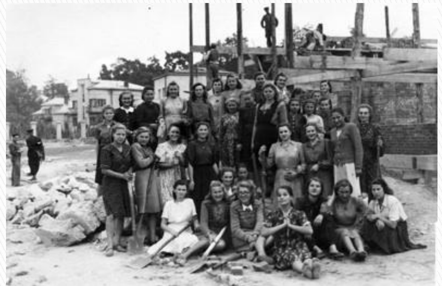
Мешканці м. Львова