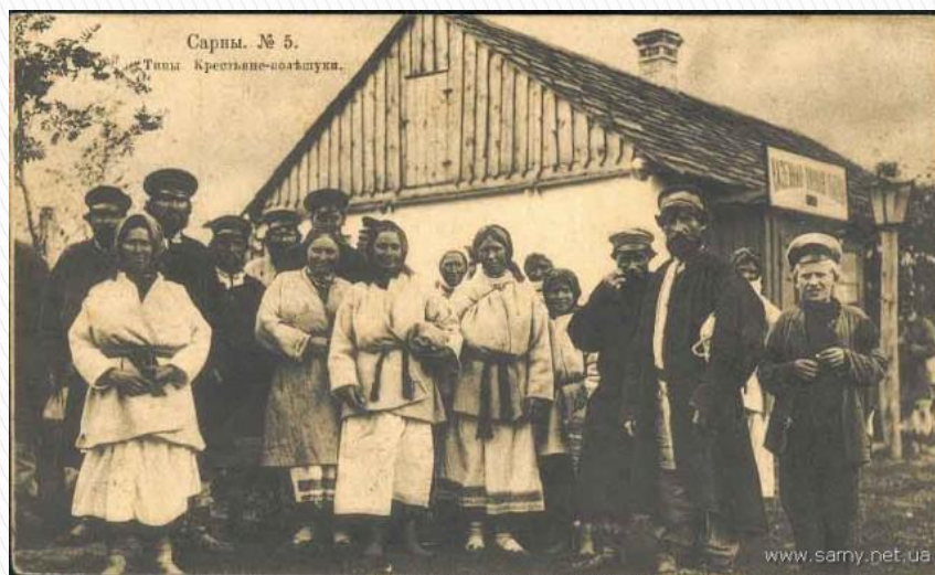
Перед роботою на полі