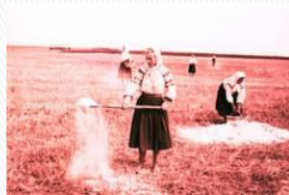
Внесення міндобрива в колгоспі Київської області