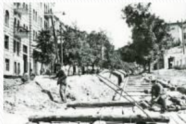
м. Київ. Прокладання газових мереж