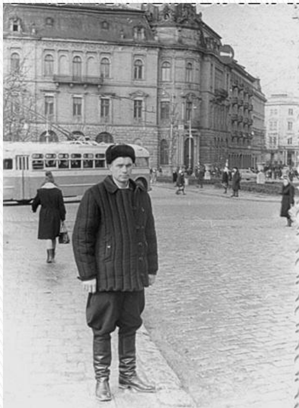
По дорозі на роботу. М. Львів. 1946 рік