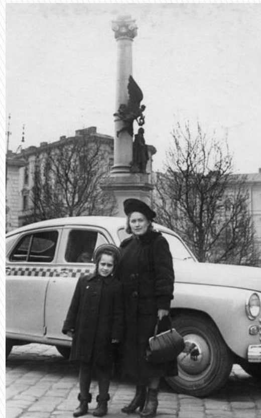
Мешканки м. Львова 1946 рік