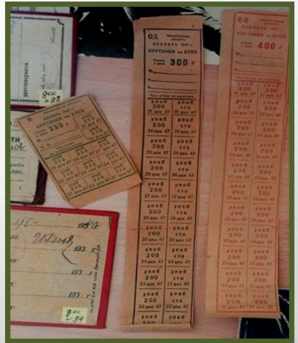
Хлебные карточки (фото экспозиции Миньярского историко-краеведческого музея)