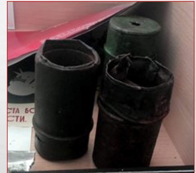
Военная продукция Миньярского завода – корпуса гранат

(фото экспозиции миньярского историко- краеведческого музея «Зал боевой Славы»)