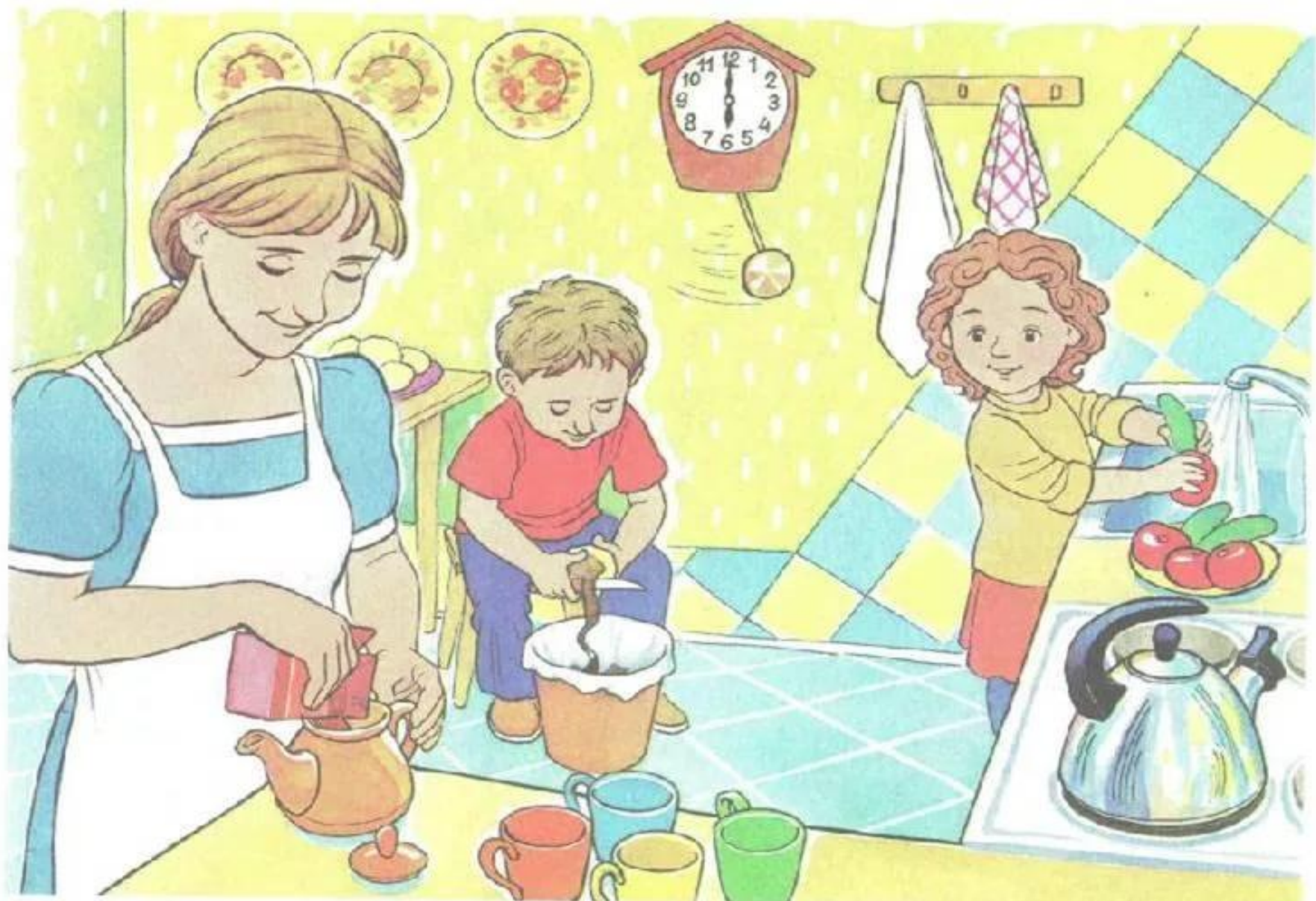
Рис. 10. К занятию 14. Составление рассказа «Семейный ужин» по серии сюжетных картин (с элементами творчества).