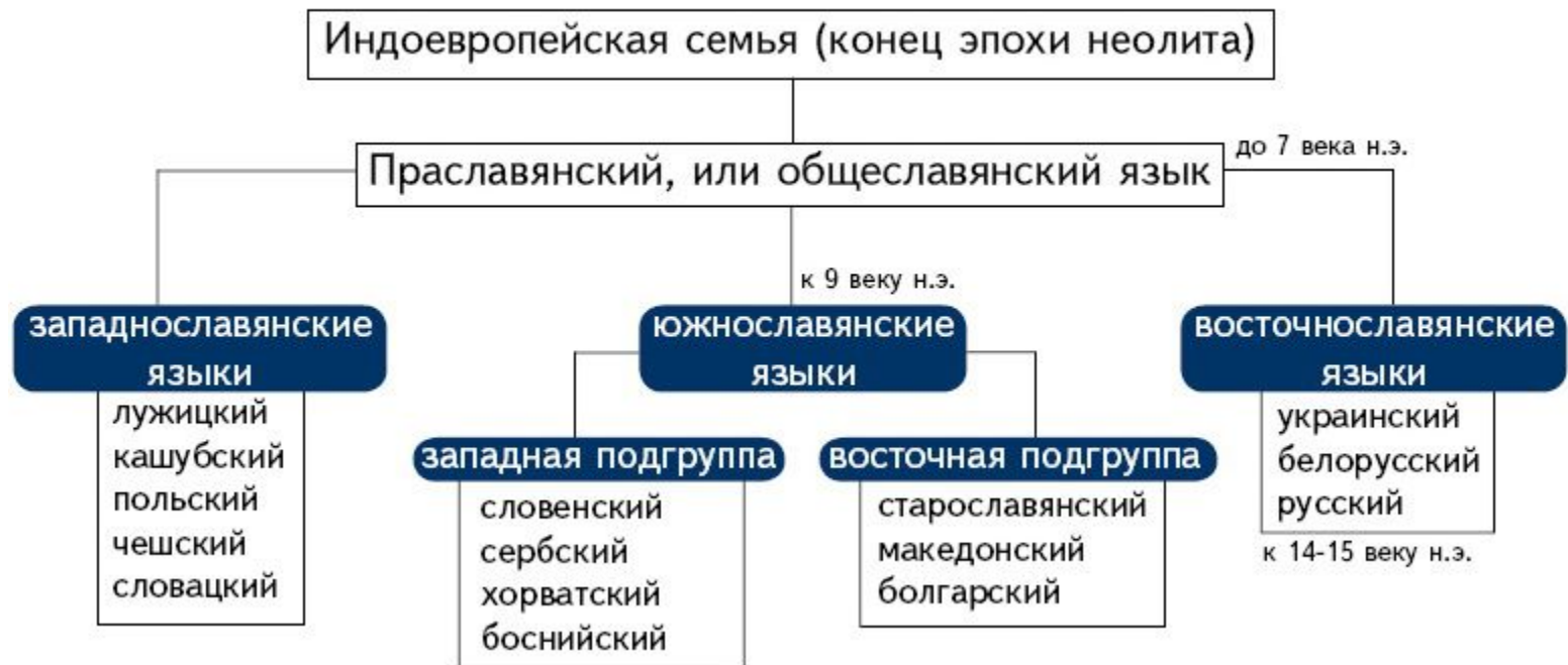
Родословное (генеалогическое) древо славянских языков