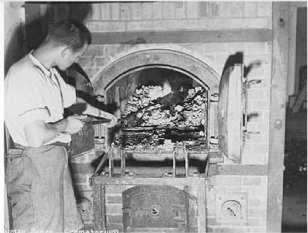
Человеческие останки, найденные в крематории концентрационного лагеря Дахау