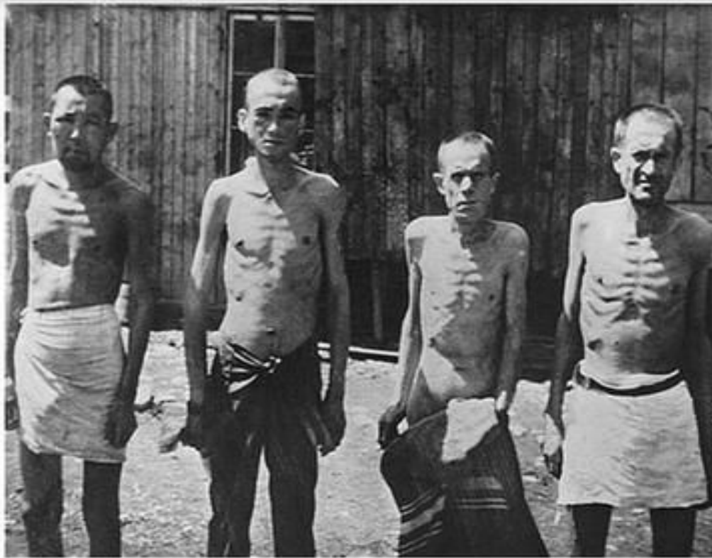
Советские военнопленные в концентрационном лагере Маутхаузен. Австрия, январь 1942 года.