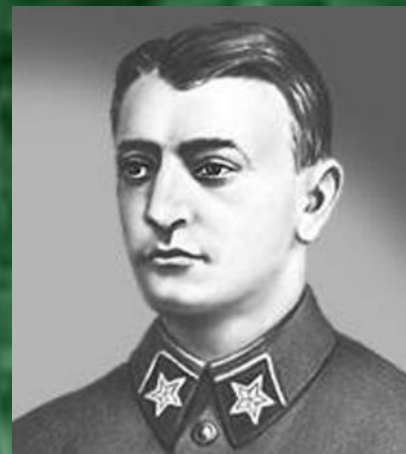
ТУХАЧЕВСКИЙ Михаил Николаевич