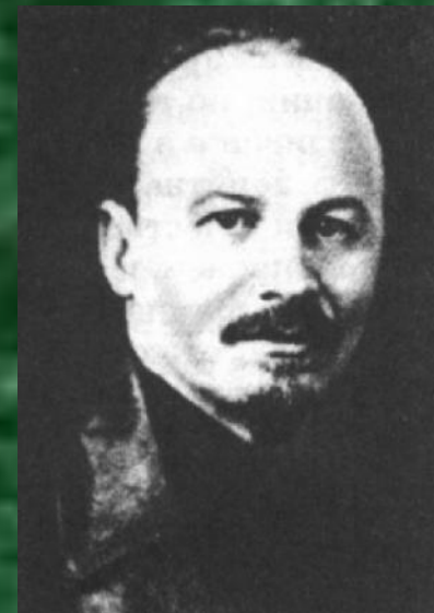
БУХАРИН Николай Иванович