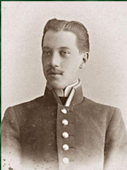
ГУМИЛЕВ Николай Степанович