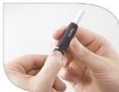
Нажмите и удерживайте Кнопку включения несколько секунд, пока индикатор не начнет мигать зеленым.