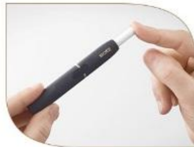
Вставьте стик табачной частью вниз до серебряной линии.