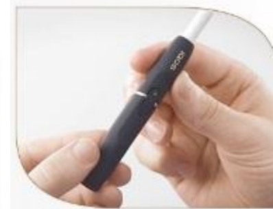
Когда индикатор загорится постоянным зеленым цветом, стик готов к использованию.