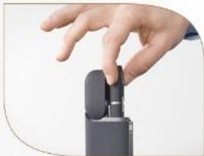
Достаньте Держатель из Зарядного устройства.