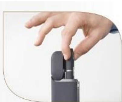
Достаньте Держатель из Зарядного устройства.