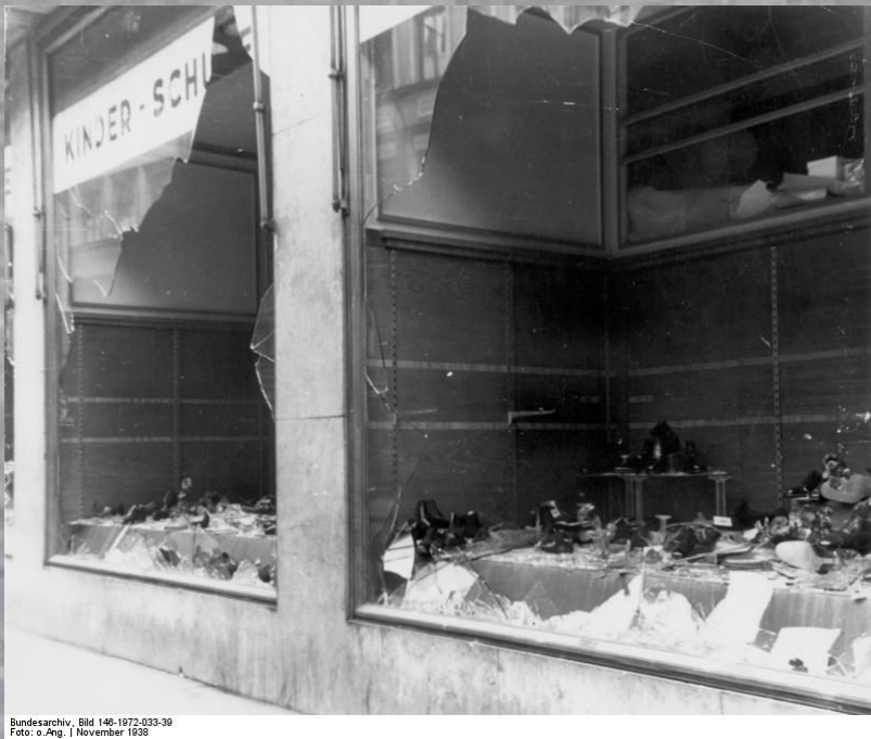
I November 1938