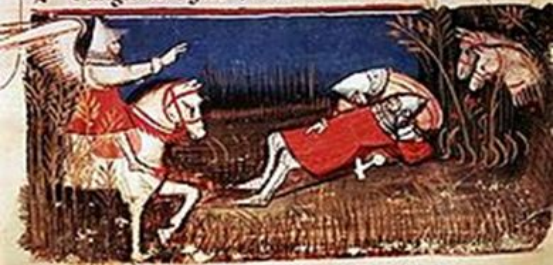
«Пісня про Роланда». Рукопис 14 ст.

enezos agardet triouque lante purant. I la relpodinet tot auelste comant. s' d'xnaus tonet lome li tous aigue coit. ues li chaxa celiu soz sun escau pelant. e angle les signa por un tel couenit.