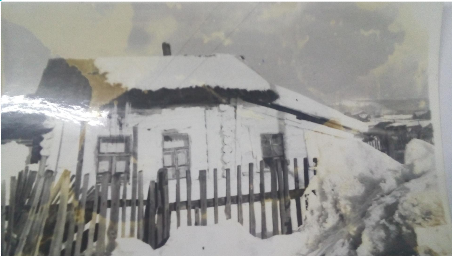
И.Х.Абызбаевтын Сермөндөгө тыуған йорто.