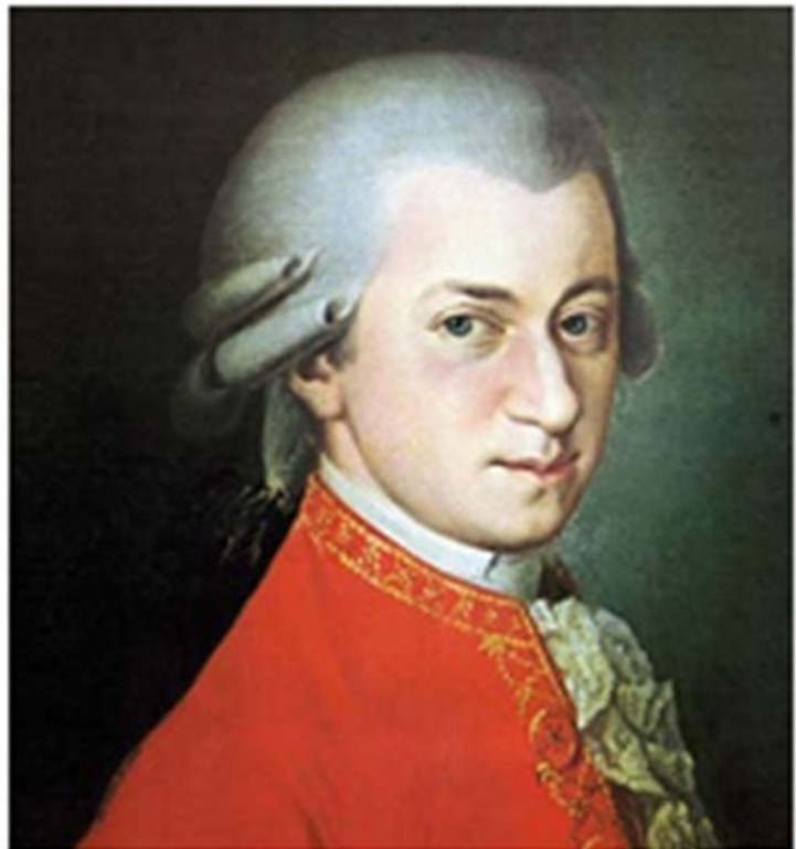
Неизвестный художник. В.А. Моцарт

Портрет любого деятеля культуры и искусства создают прежде всего его произведения: музыка, картины, скульптуры и пр., — а также его письма, воспоминания современников и художественные произведения о нем, возникшие в последующие эпохи.