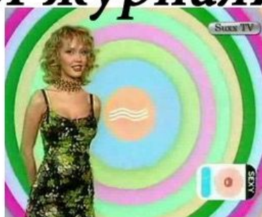
как меня видят друзья