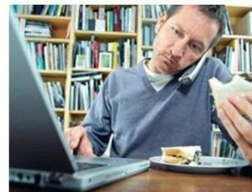
как все выглядит