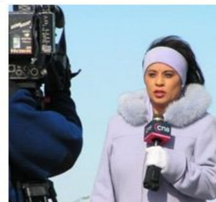
как меня видят родители