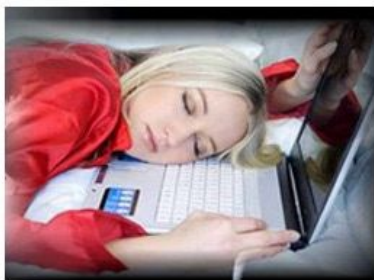
как меня видят преподаватели