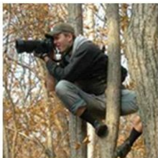
как меня видят люди