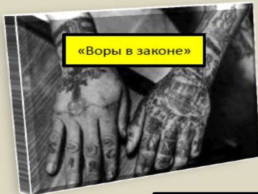
«Воры в законе»