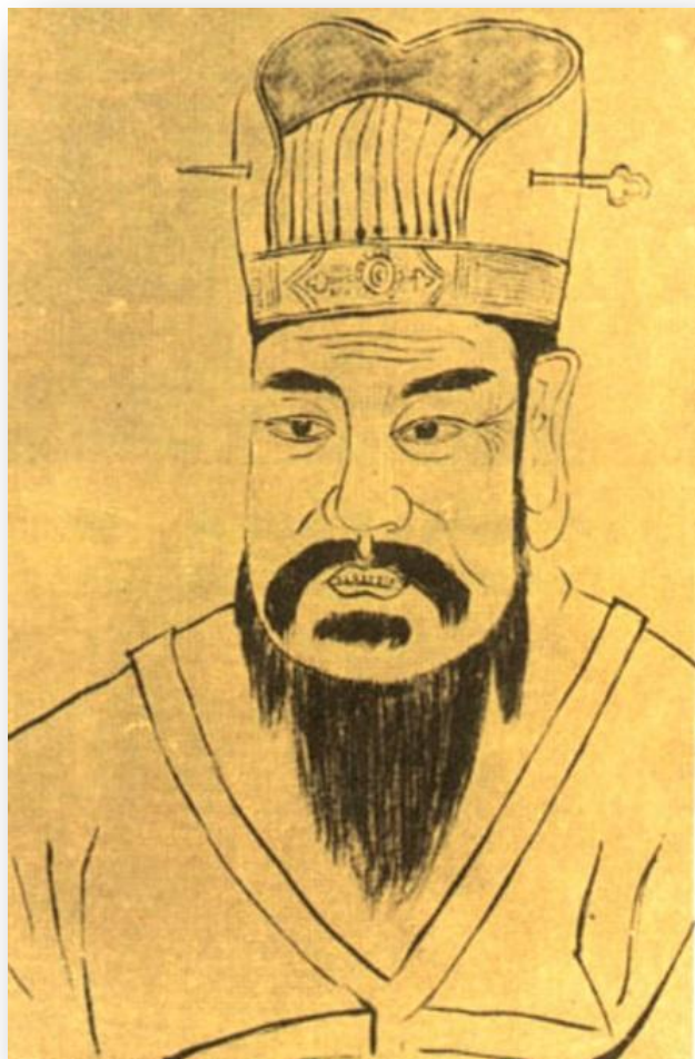
Ван Ман 王莽 (45 до н. э. — 23 г. н.э.) китайский император в 9—23 гг.