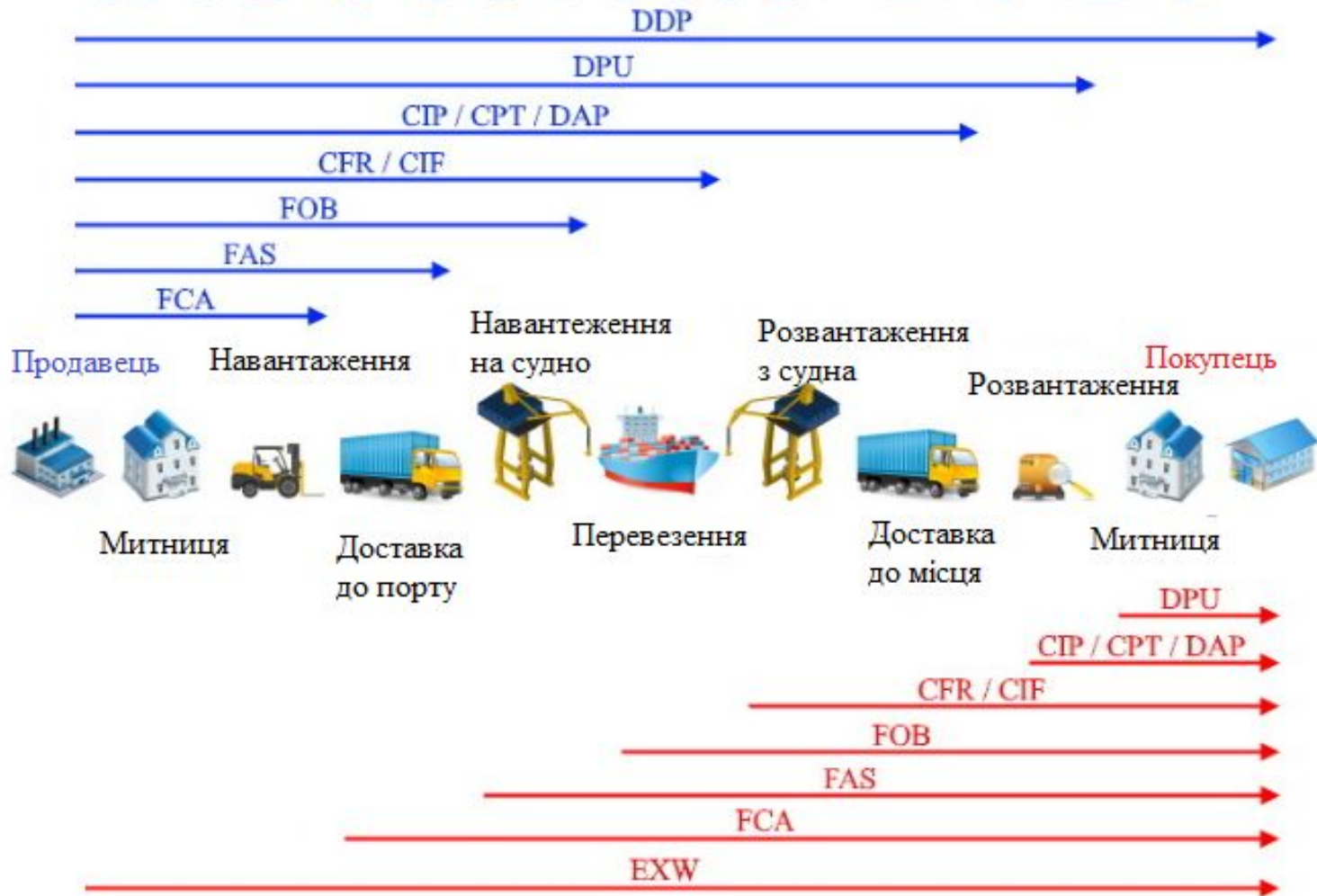
Рисунок – Схематичне представлення правил Incoterms 2020