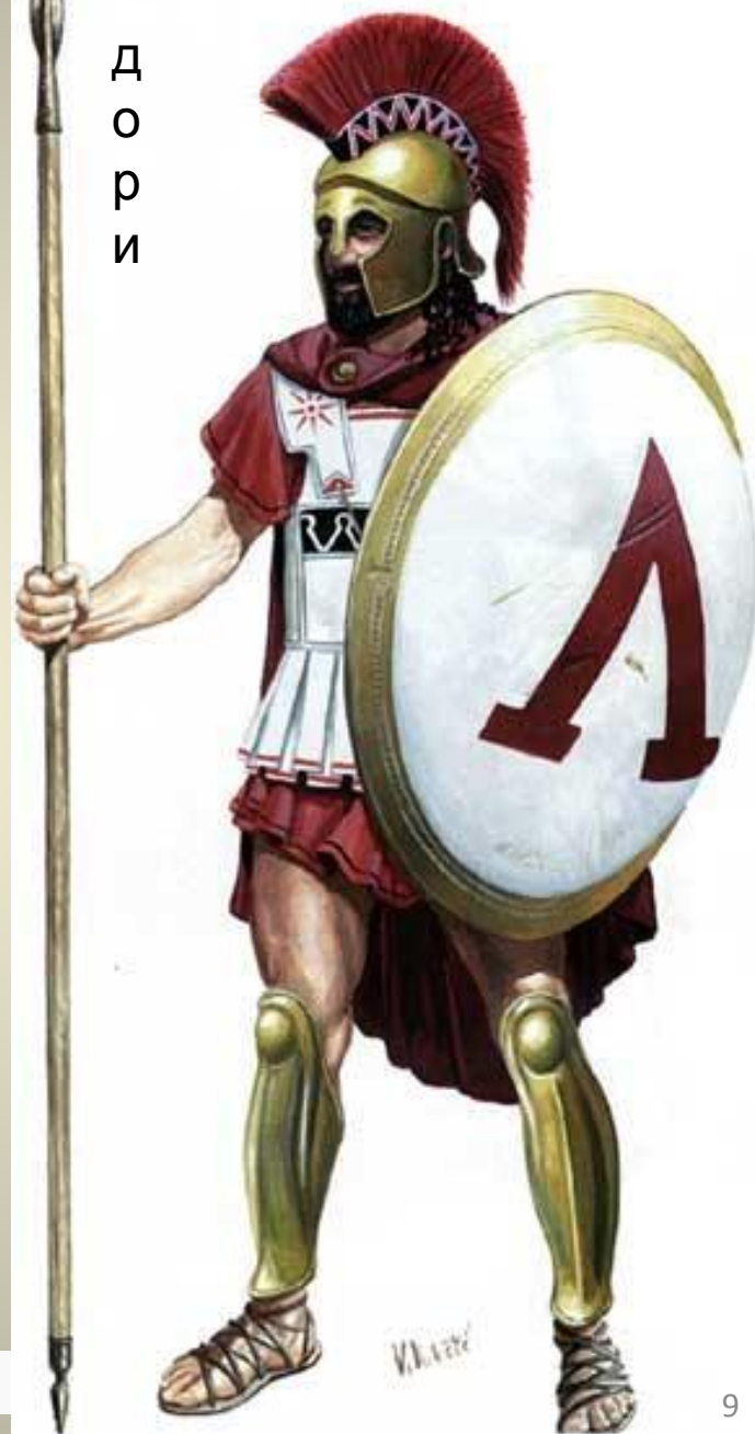
Д О Р И