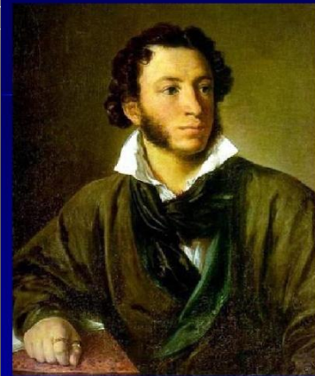
Александр Сергеевич Пушкин

Так чему же учит нас великий поэт? Я думаю, что в первую очередь -- любви к своей родине, большой и малой. Одной из главных черт творчества Пушкина был патриотизм. Каждая строчка его стихотворений проникнута горячей любовью к России,