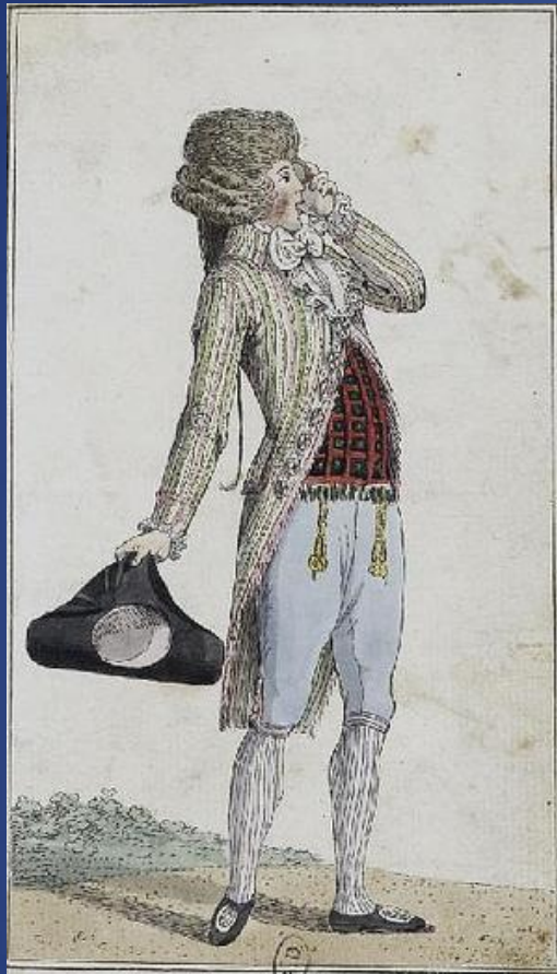
Élegant de Paris