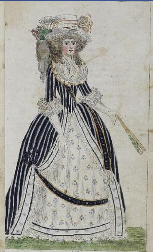
Parisienne en grande parure. Sept. 1781