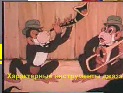
Характерные инструменты джаза.

Соло хорошего трубача, саксофониста, пианиста или контрабасиста - многокрасочная импровизация онная