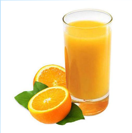
Le jus de fruit