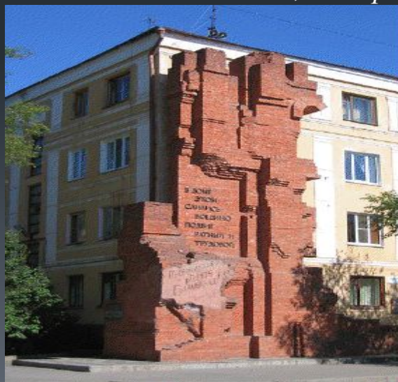
Современный вид на дом Павлова