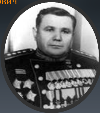
Ерёменко, Андрей Иванович

План предстоящего наступления получил кодовое название «Уран» - контрнаступление войск трёх фронтов: Юго-Западного (командующий — генерал Н. Ф. Ватулин), Сталинградского (командующий — генерал А. И. Еременко) и Донского (командующий — генерал К. К. Рокоссовский) с целью окружения и уничтожения вражеской группировки войск в районе города Сталинграда.