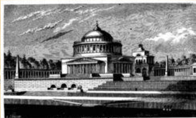
ХРАМЪ ХРИСТА СПАСИТЕЛЯ ВЪ МОСКВѢ, ПРОЕКТЪ АКАДЕМИКА ВИКТОРА.

В ознаменование победы в Отечественной войне 1812 года было поставлено множество памятников и мемориалов, из которых наиболее известными являются Храм Христа Спасителя (Москва) и ансамбль Дворцовой площади с Александровской колонной (Санкт-Петербург).