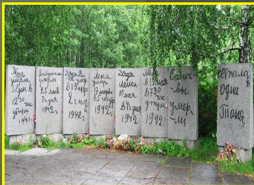
Памятник семье Савичевых

Таня Савичева жила в ленинградской семье. Началась война, затем блокада. На глазах Тани погибли её бабушка, двое дядей, мама, брат и сестра. Когда началась эвакуация детей, девочку удалось вывезти по Дороге Жизни на «Большую землю». Врачи боролись за её жизнь, но медицинская помощь пришла слишком поздно. Таня Савичева умерла от истощения.