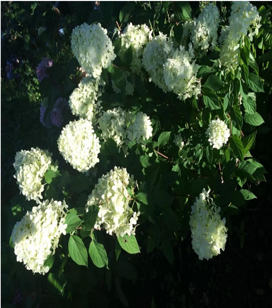
Метельчатая МЭДЖИКАЛ МУНЛАЙТ

Для черенкования метельчатой гортензии подходят только зеленые черенки, которые нарезают летом, пока растение не расцвело!