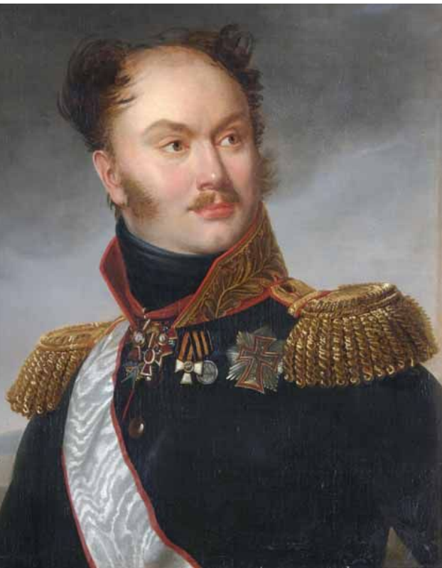
Портрет Михаила Фёдоровича Орлова кисти Анри-Франсуа Ризенера, 1810-е.

возвращения армии из заграничного похода в 1814 г. Одним из основателей был М. Орлов.