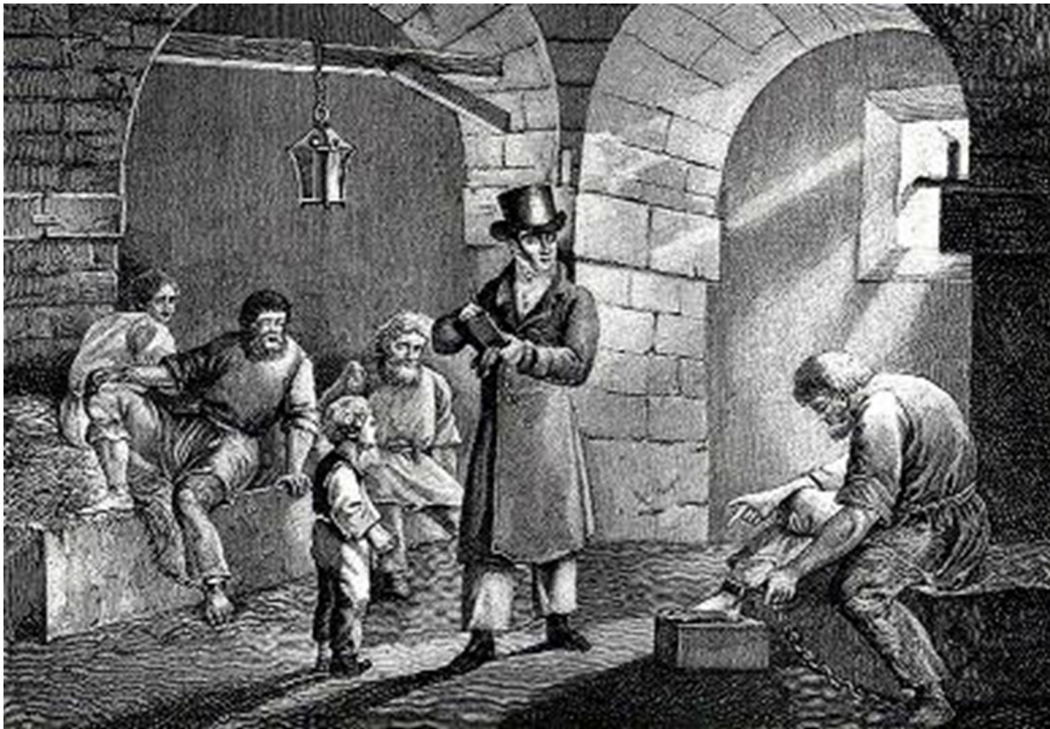
Тюрьма в России в начале 19 века.