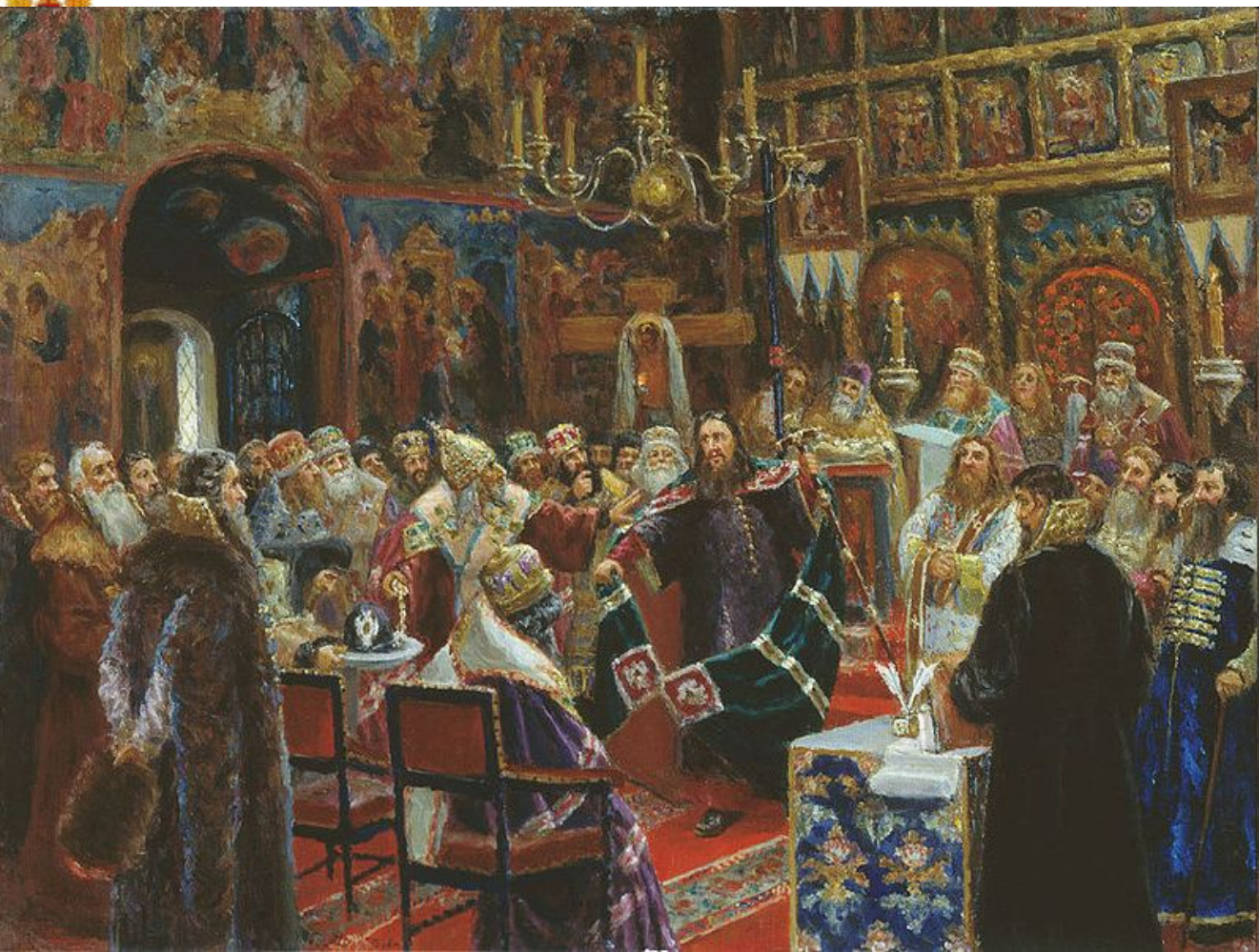
Суд над патриархом Никоном (С. Д. Милорадович, 1885 год)

В 1666 г. состоялся суд , на который под охраной стрельцов привезли Никона. Его свели с патриаршества и сослали в Ферапонтов монастырь, потом перевели в Кирилло-Белозерскую обитель, где он и скончался в 1681 г.