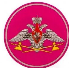
Тыл ВС РФ