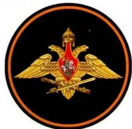
ГШ ВС РФ