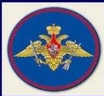
Ракетные войска стратегического назначения