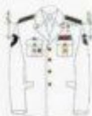
На службе (на гражданке)