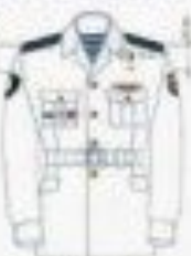
На службе (на гражданке)

Ношение государственных наград, наградных, нагрудных и нарукавных знаков различия военнослужащими - женщинами