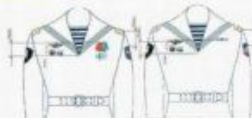
На флотском и флотском