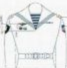
на флотском и флотском (на гражданке)

Ношение государственных наград, наградных, нагрудных и нарукавных знаков различия военнослужащими береговых войск ВМФ