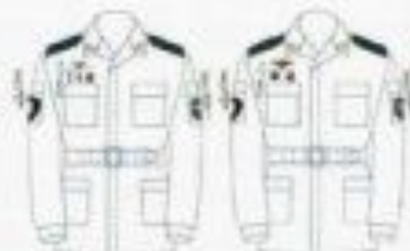
На отдыхе (на гражданке)