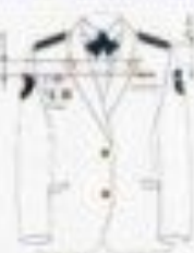
На службе (на гражданке)

Размещение эмблем На углах воротника На углах лацканов