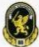
Главное командование внутренних войск

Нарукавные знаки принадлежности к округам внутренних войск МВД России