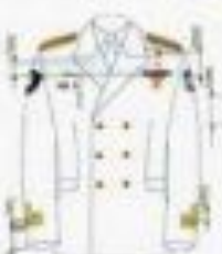
На службе (на гражданке)