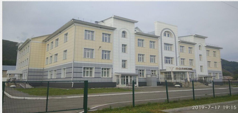
КГБУЗ «Чарышская ЦРБ»

В последние годы весьма интенсивно в с.Чарышское, как и в районе в целом, развивается туристический сектор. Отдых в с. Чарышское возможен как в формате сельского туризма, так и на комфортабельных усадьбах и туристических базах, которые организуют сплавы по реке Чарыш, экскурсии, конные прогулки.