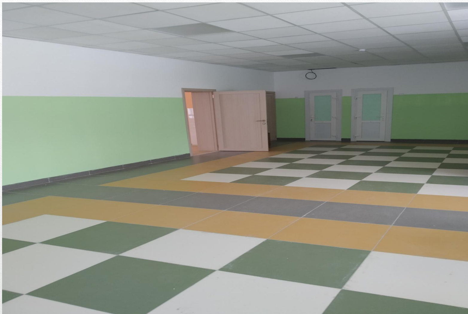
Рекреация начальных классов