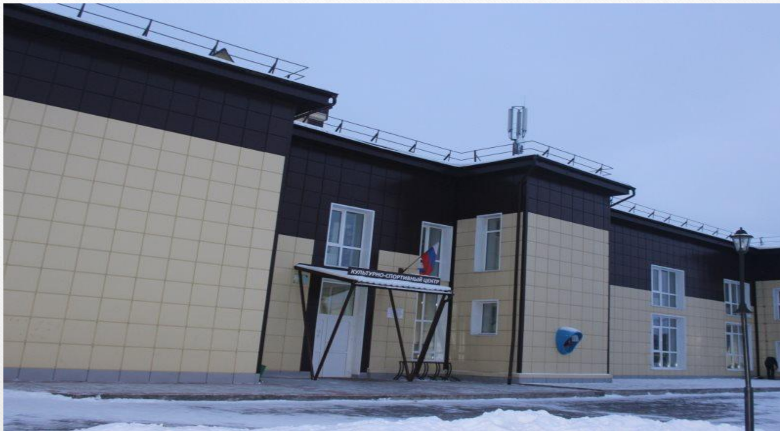
Районный Дом культуры