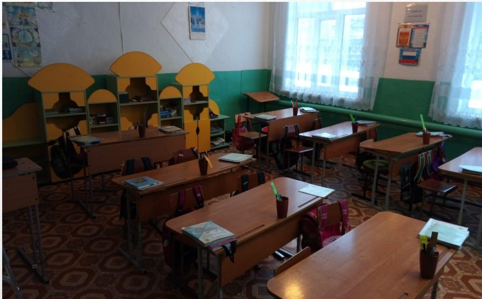
Кабинет начальных классов