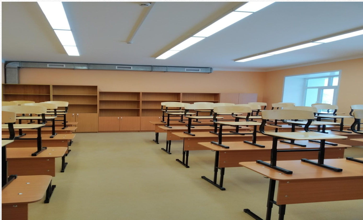
Кабинет начальных классов, 1 этаж