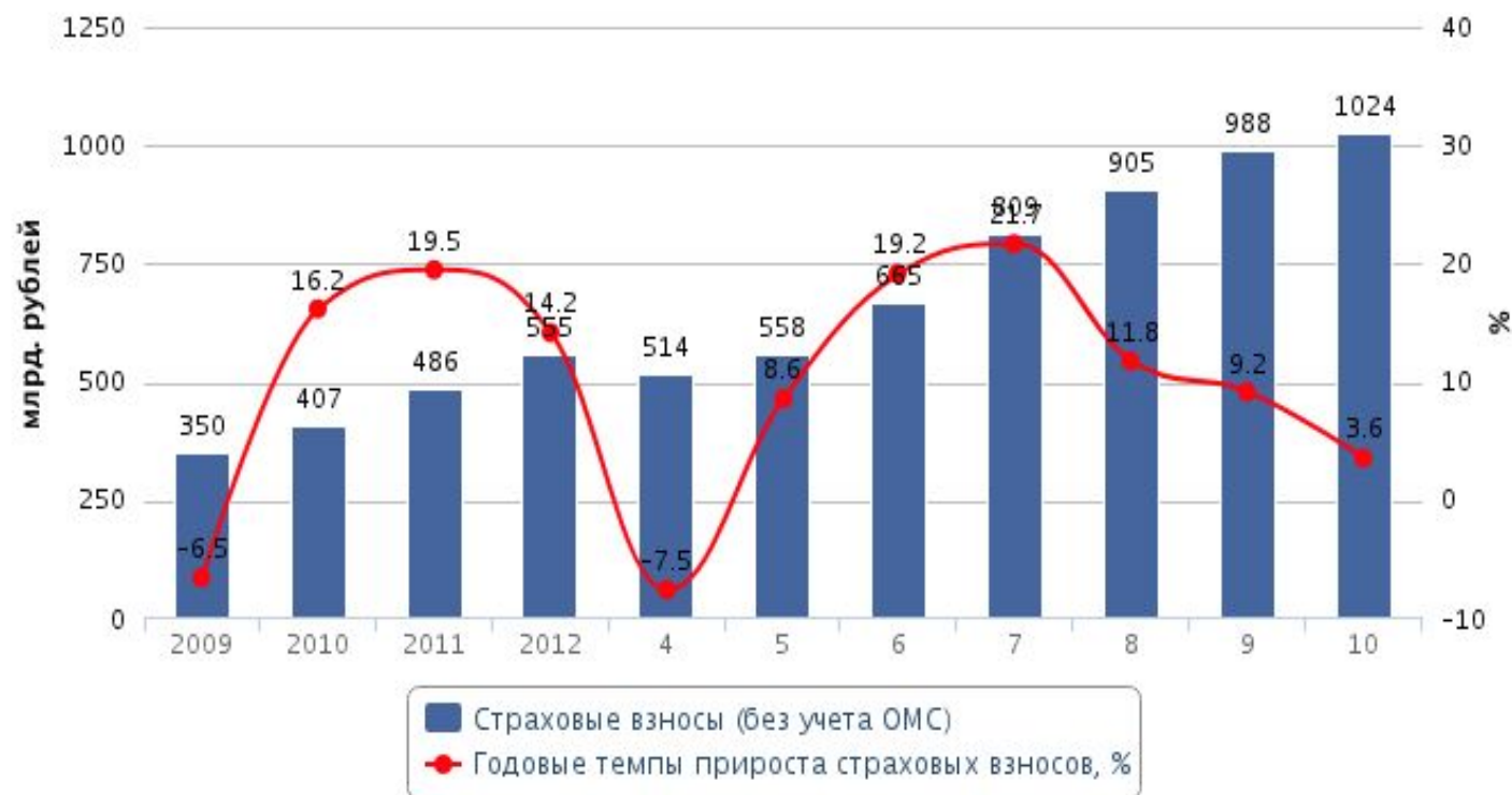
График 1. Динамика страховых премий