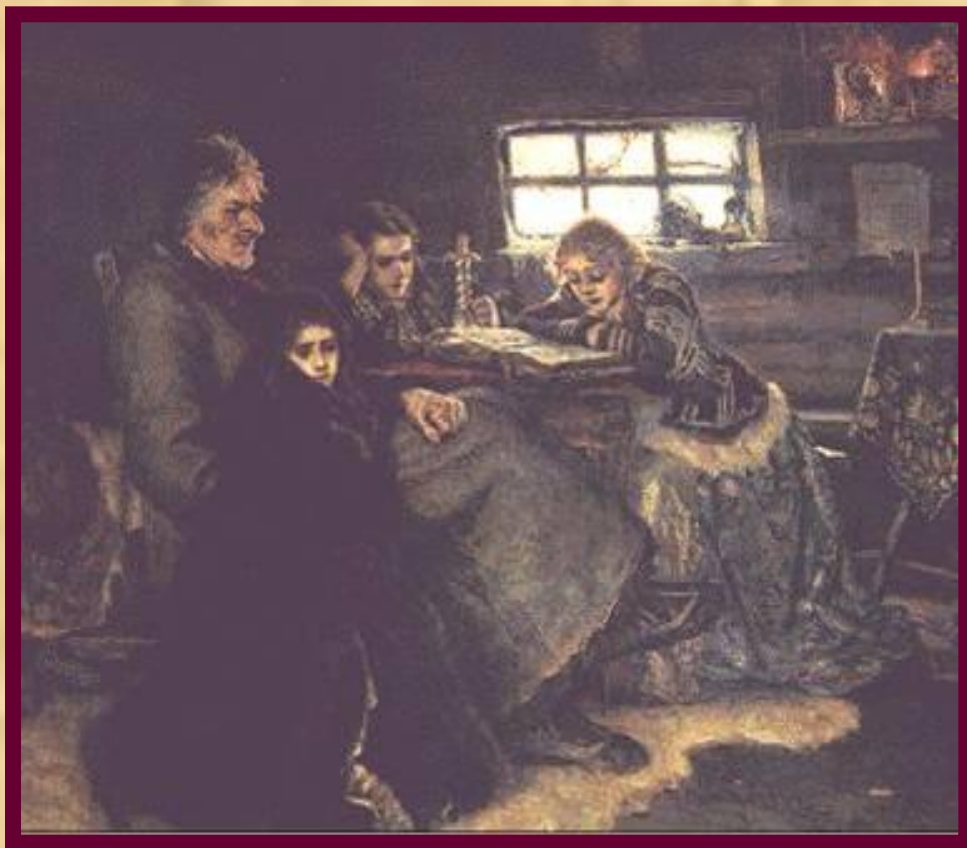
А.Меншиков в ссылке в Березове.

В сентябре 1727 г. Меншиков был арестован и сослан на Урал в Березов, где в 1729 г. скончался. Долгорукие и Голицыны удалили со службы соратников Петра I и свернули реформы.