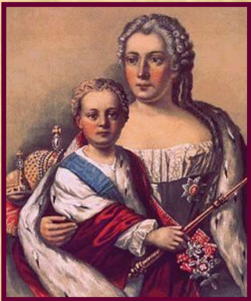
Иван VI и Анна Леопольдовна

Анна, не имевшая детей, незадолго до смерти пригласила в Россию своего племянника-Ивана Антоновича и его родителей-Антон Ульриха и Анну Леопольдовну. Когда в к. 1740 г. Анна Иоанновна скончалась Ивану VI было всего 11 месяцев. По завещанию регентом был назначен Э. Бирон.