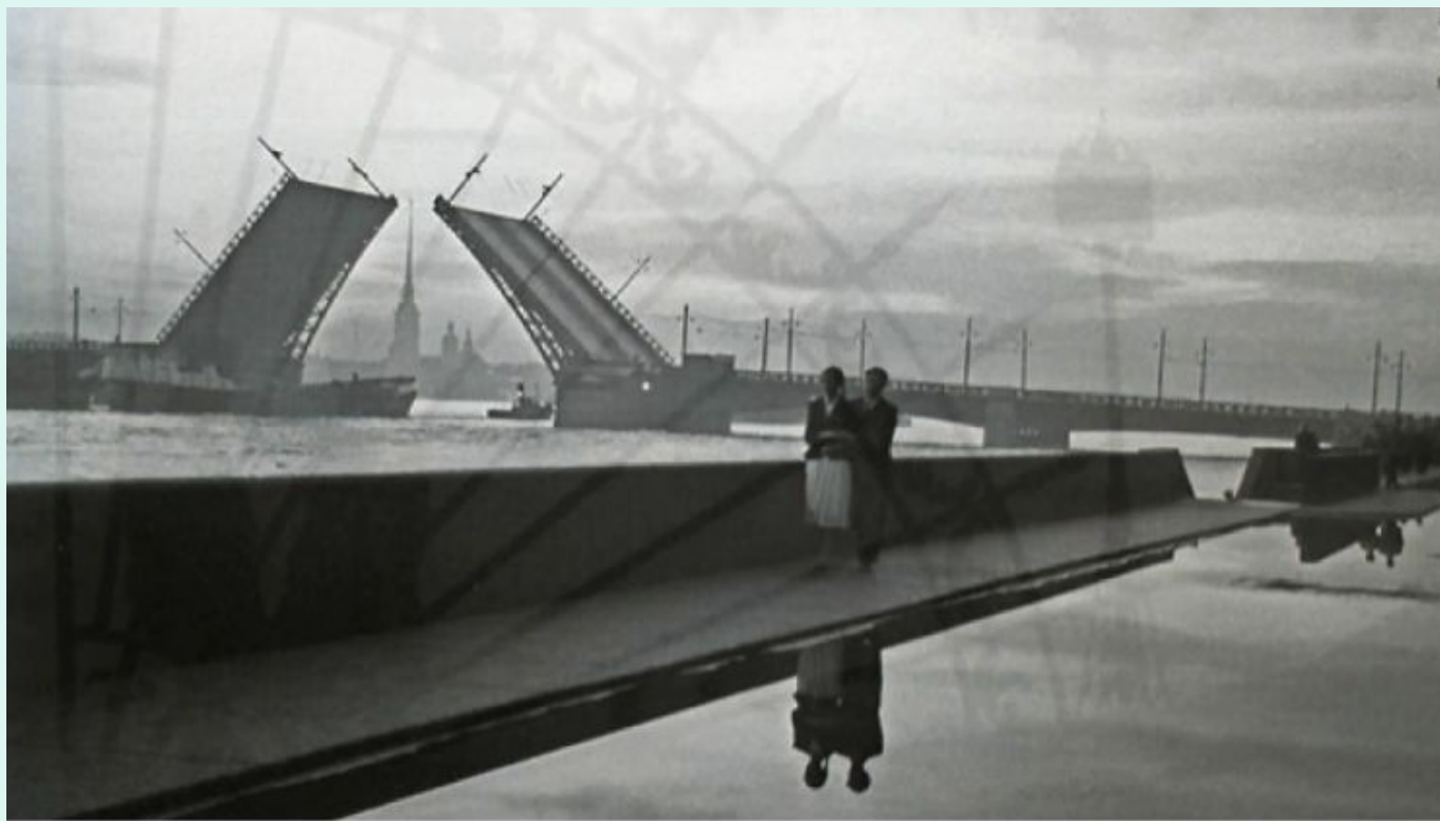
Белые ночи. Ленинград. 1941 г., фотокопия