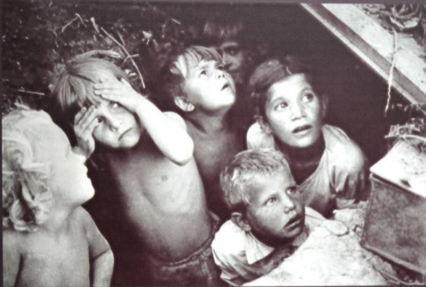
ДЕТИ ПАМЯТНОГО ИЮНЯ 1941 ГОДА