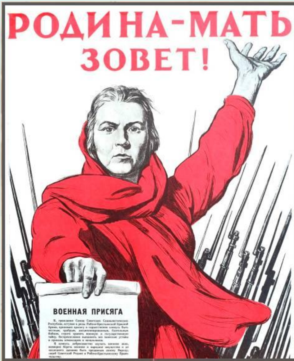
Плакат «Родина-мать зовет!», Художник Тоидзе И.М., 1941г., Копия