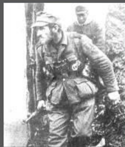
СМЕРТЬ И РАЗРУШЕНИЯ ПРИНЕСЛИ ГИТЛЕРОВЦЫ НА НАШУ ЗЕМЛЮ