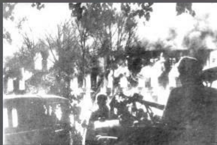
ФАШИЗМ-ЭТО СМЕРТЬ И РАЗРУШЕНИЯ