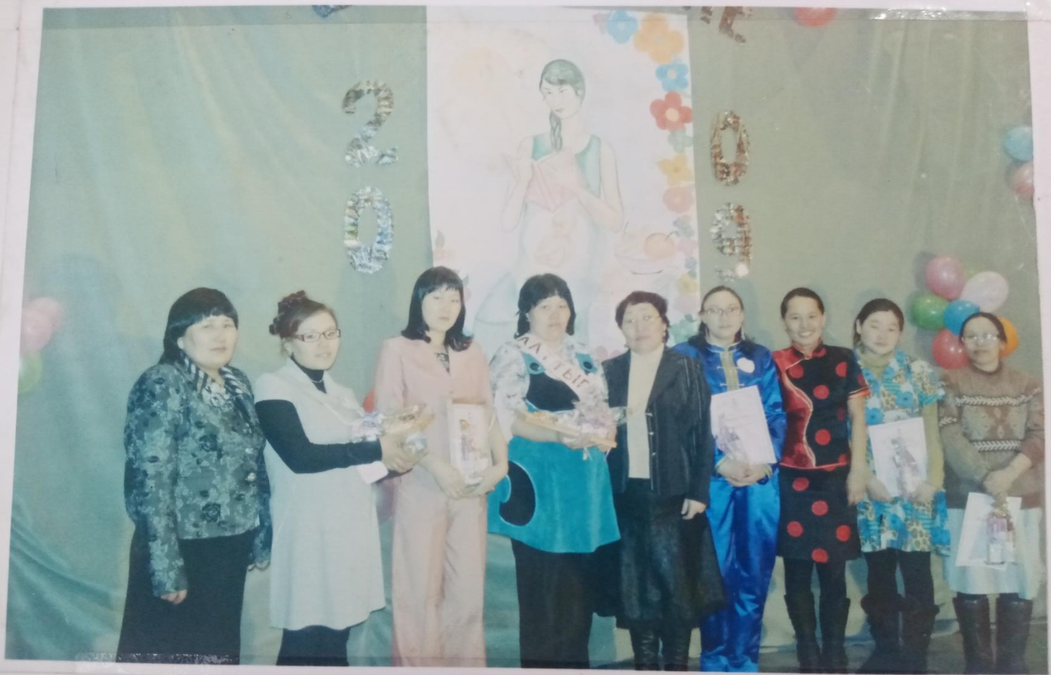
«Сааттыг ие-2009» киржикчилери болгаш эртирикчилери