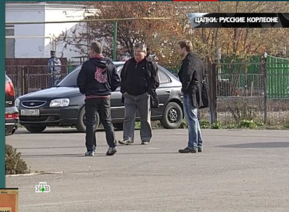
3. Цапки, рэкетеры и бандиты из 90-ых