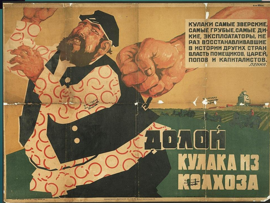
2. Кулак в советской деревне