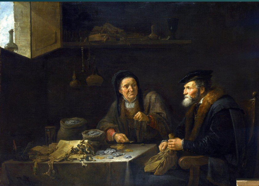
1. Картина средневекового ростовщика