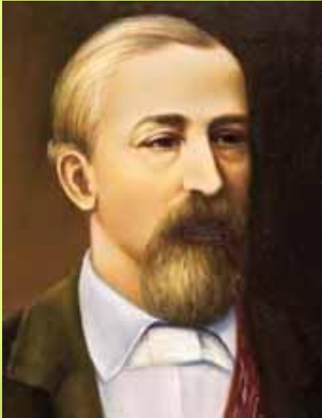
Александр Порфирьевич Бородин

До встречи с Балакиревым ученый-химик не придавал серьезного значения своим музыкальным занятиям. Он всегда самозабвенно слушал музыку, участвовал в ее исполнении, кое-что писал сам, но никогда не думал о музыке как о профессии; “... мне кажется, что, по всей вероятности, я был первым, сказавшим ему, что его настоящее дело – композиторство. Он с жаром принялся сочинять свою симфонию, каждый такт которой проходил через мою критическую оценку”, - писал Балакирев.