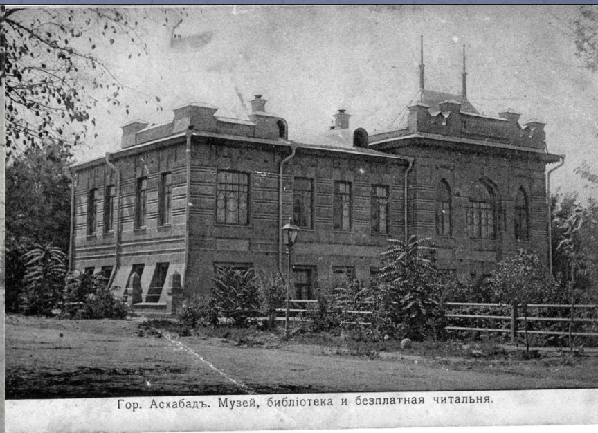
Гор. Асхабадъ. Музей, библиотека и бесплатная читальня.

В 1944 году она поступила и в 1949 году окончила лечебный факультет Ашхабадского медицинского института