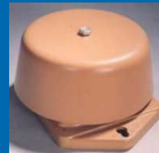
Звонки громкого боя и электросирены