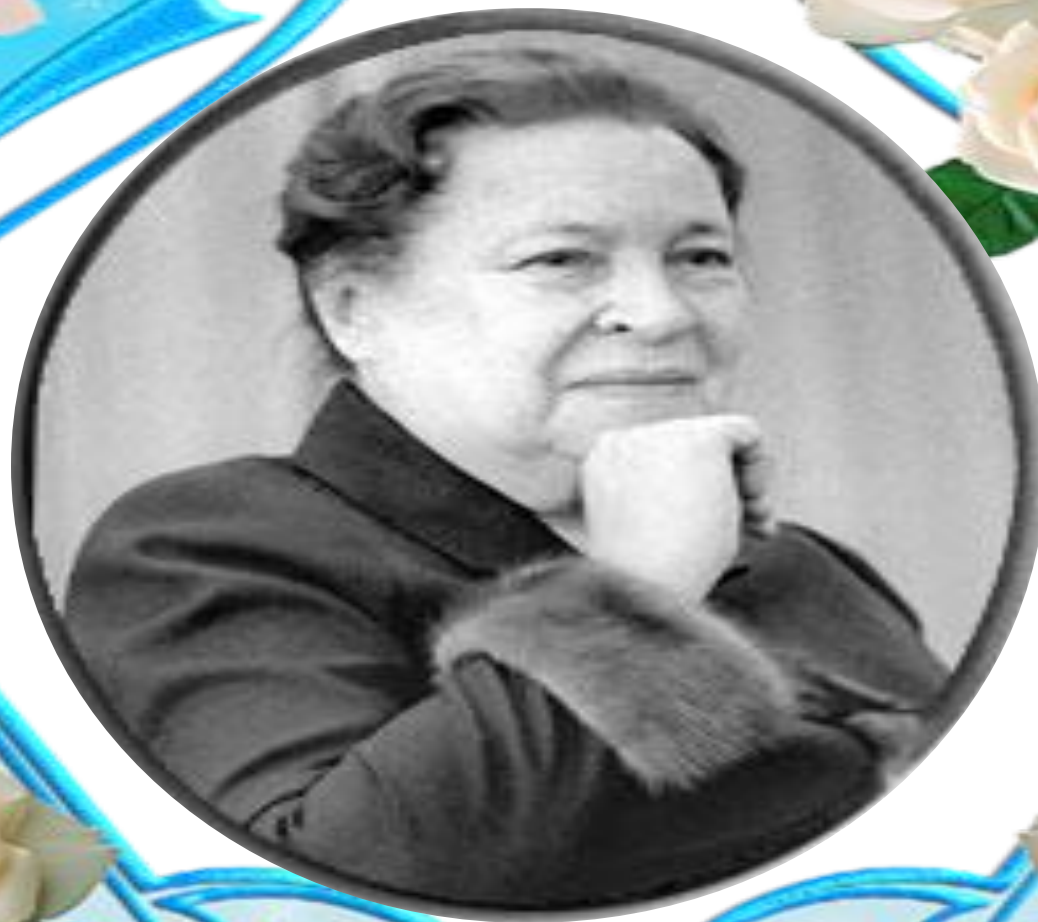
Агния Львовна Барто