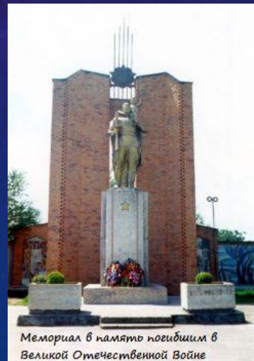
Мемориал в память погибшим в Великой Отечественной Войне