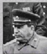
И. В. Сталин (СССР)