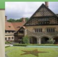
Дворец Цецилиенхоф — место проведения Потсдамской конференции