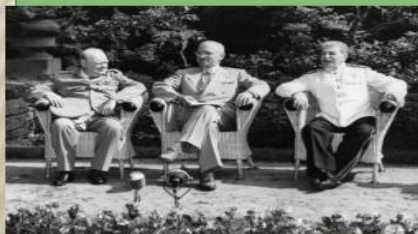
У. Черчилль, Г. Трумен, И. Сталин