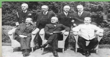
К. Этгли, Г. Трумэн, И. Сталин