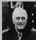
Ф. Д. Рузвельт (США)