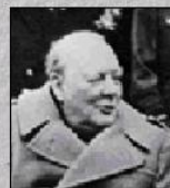
У. Черчилль (Великобритания)