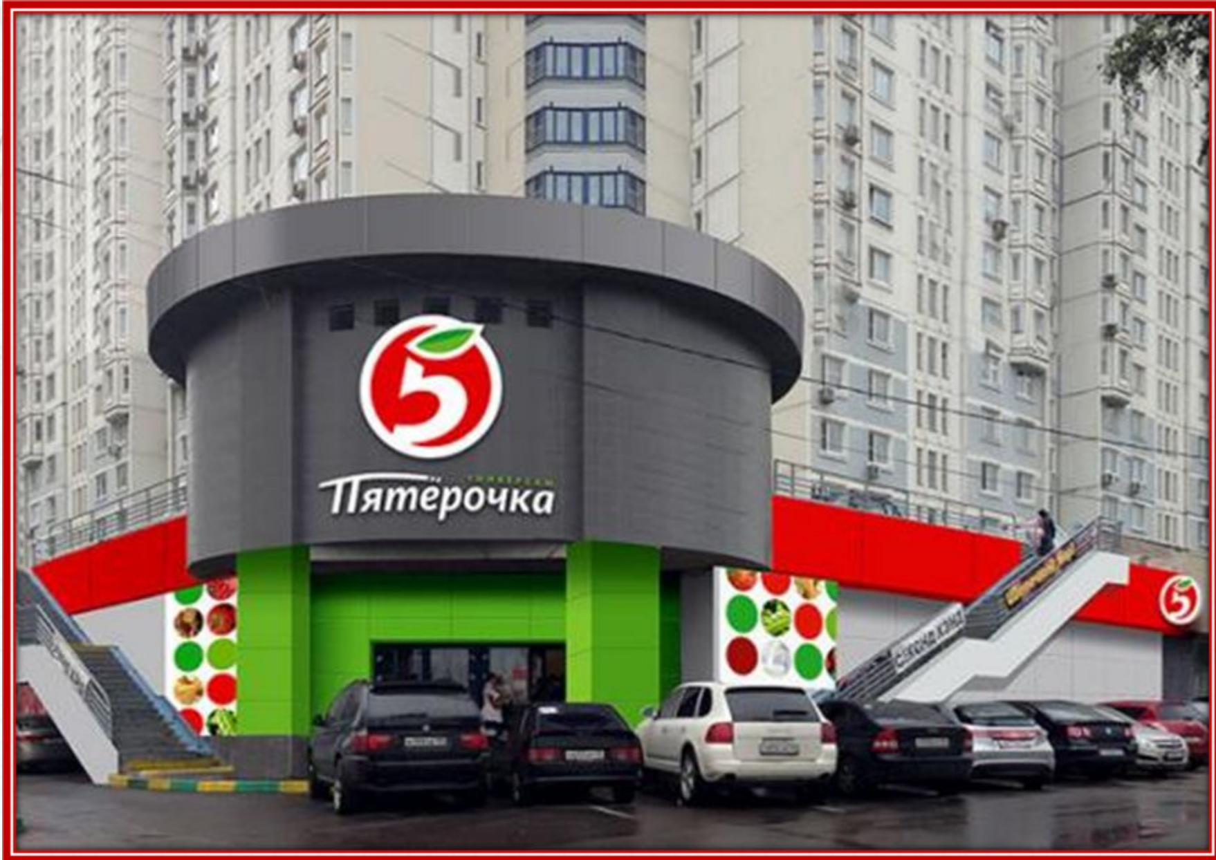
Витрина продуктового магазина.