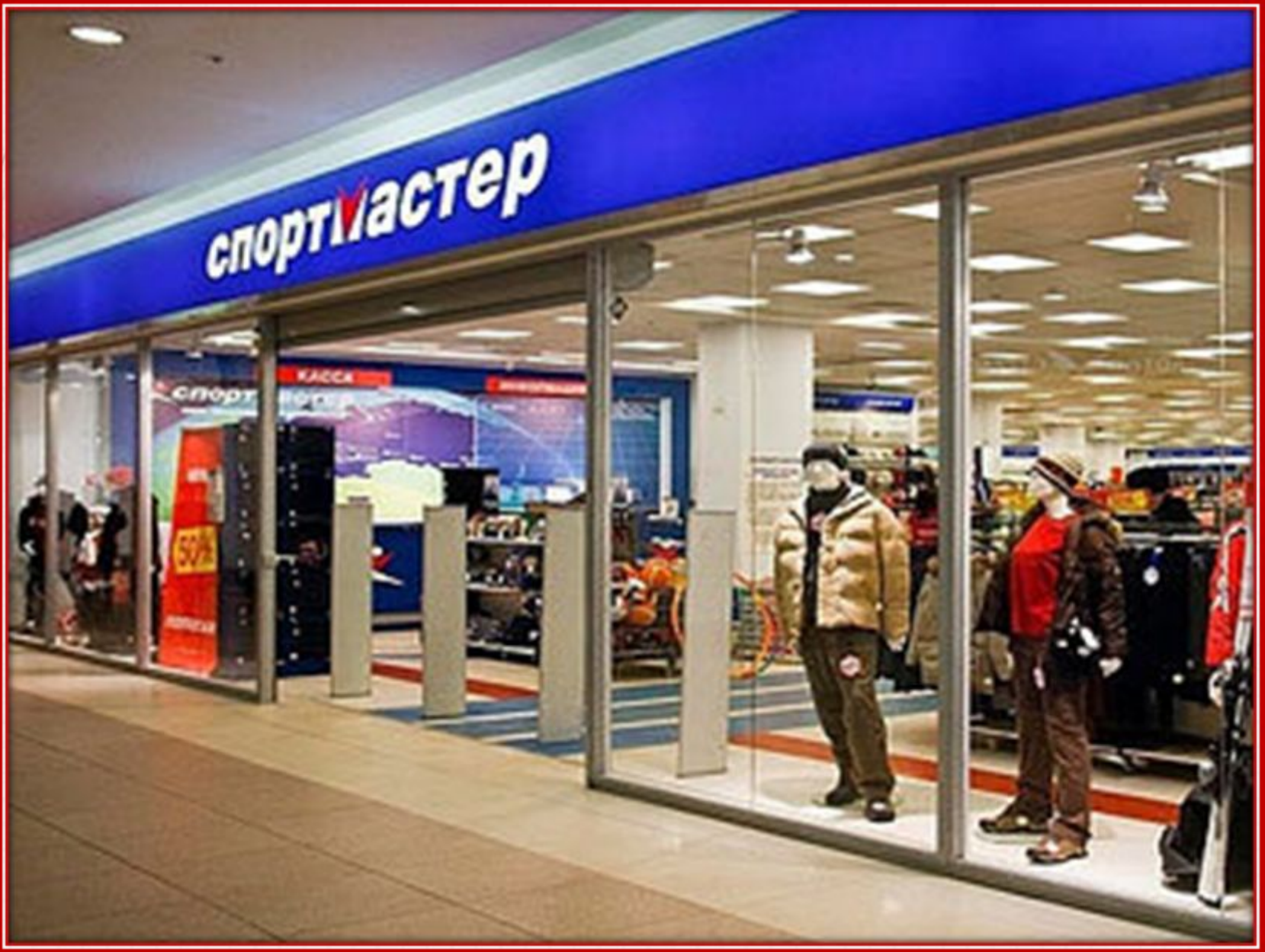
Витрина спортивного магазина.