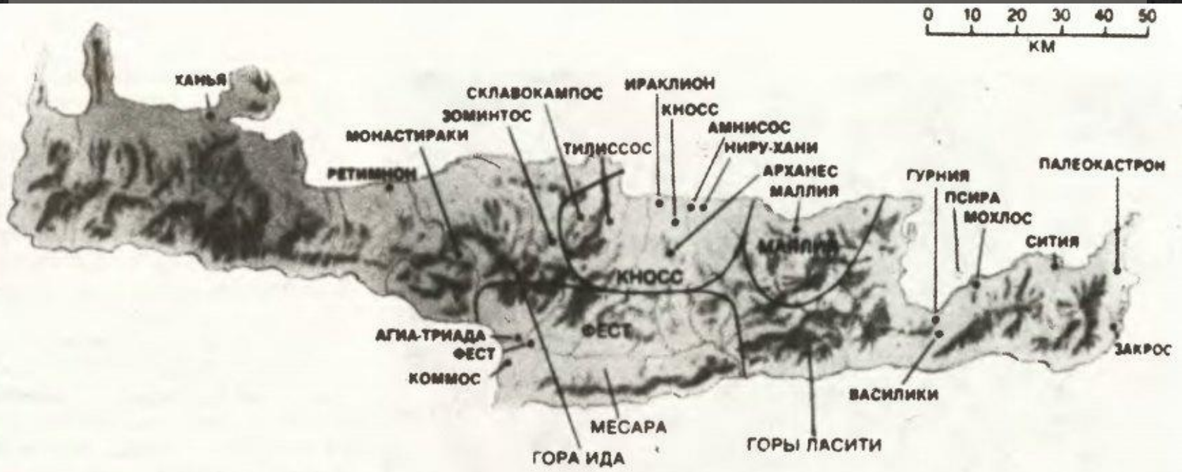
Карта острова Крит. Точками обозначены места раскопок.