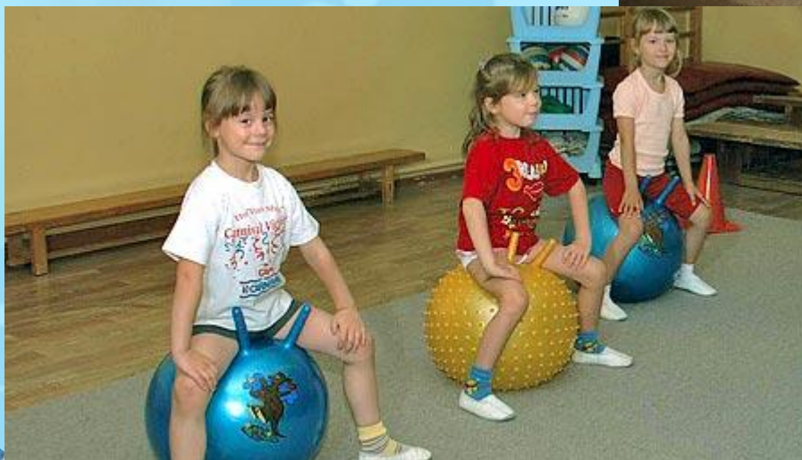
фитбол - гимнастика