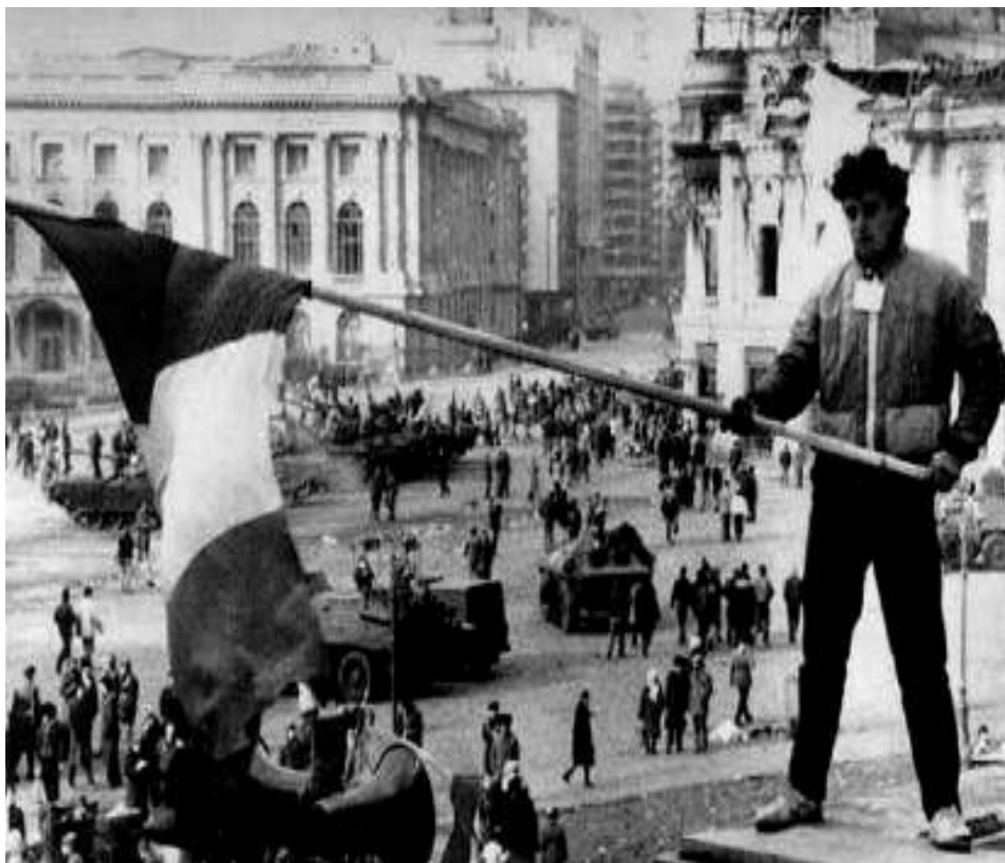
Революция в Бухаресте.

Перемены в Восточной Европе начались в 1987 г. Под давлением Горбачева здесь начался процесс смены политического руководства, демократизация общества. С 1989 г. начался процесс вывода из региона советских войск. В результате «бархатных революций» пали тоталитарные режимы в ПНР, ЧССР, ВНР, БНР, Албании. В 1989 г. был свергнут режим Н. Чаушеску в Румынии.